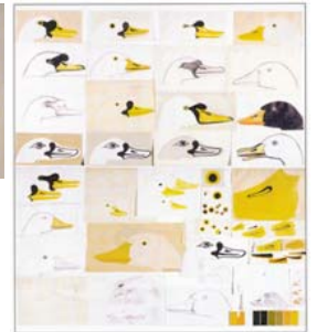
1967, Tavole di schizzi preparatori e modelli di raffronto per la realizzazione de L'Oca