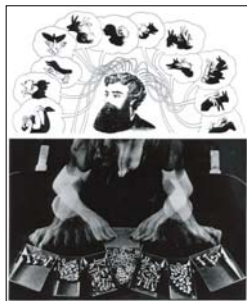
1975, Il Lavoro