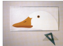
1967, Serie della Natura