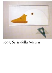
1967, Serie della Natura