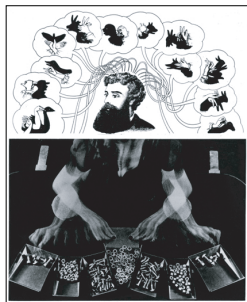
1975, Il Lavoro