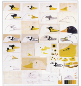
1967, Tavole di schizzi preparatori e modelli di raffronto per la realizzazione de L'Oca