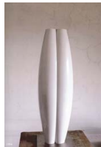
1994, Anfora doppia