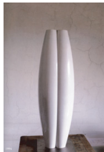
1994, Anfora doppia