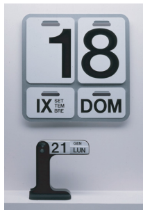
1963, Formosa 1966, Timor